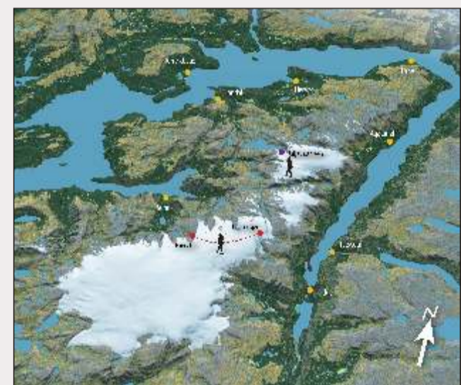
Illustration: Kjetil Helge Sjøstrøm

Der Weg zwischen Sundal nach Odda führt entlang einer historischen Route, deren Entstehung in die Zeit der Romantik zurückreicht. Gegen Ende des 19. Jahrhunderts wurden die Reisenden zu Pferde bis an den Gletscher geführt, von wo aus sie das Eisplateau bequem auf dem Schlitten überqueren konnten. Heutzutage kann diese historische Route über den Folgefonni mit einer beeindruckenden Wanderung von Fjord zu Fjord nachempfunden werden. Auf beiden Seiten des Gletschers wurden die ehemaligen Stiege für die Pferde erneuert und stellen nun einfache Wanderwege dar, auf denen man bequem zu einer der Hütten am Rande des Gletschers gelangt; hier wird man bereits vom Gletscherführer für die anschließende Tour erwartet.