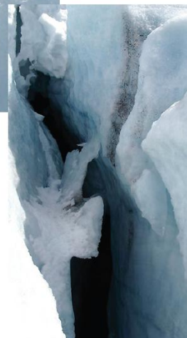
BLÅTT: Noe av det vakreste med Folgefonna er fargespekteret. Sollyset reflekteres i isen og skaper en illusjon av blått.