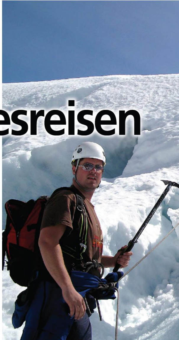
LANG, LANG REKKE: Dagens turlag består av tre amerikanske turister og en